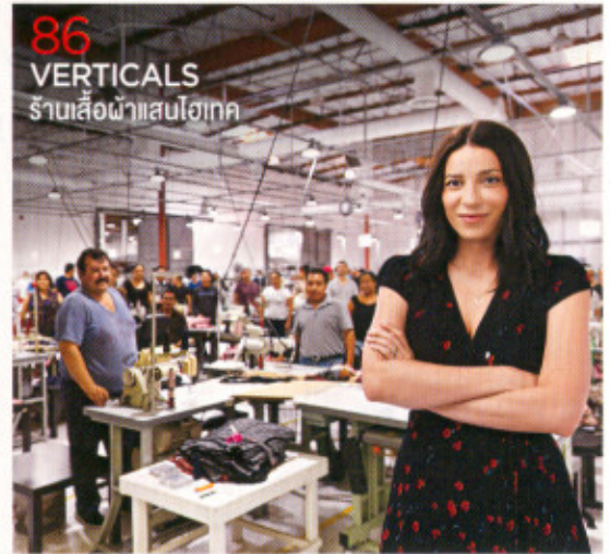
86 VERTICALS ร้านเสื้อผ้าแสนไทยคค

50 | THE NEXT BILLION DOLLAR START UP ว้ก้ท้ก้ WeWork