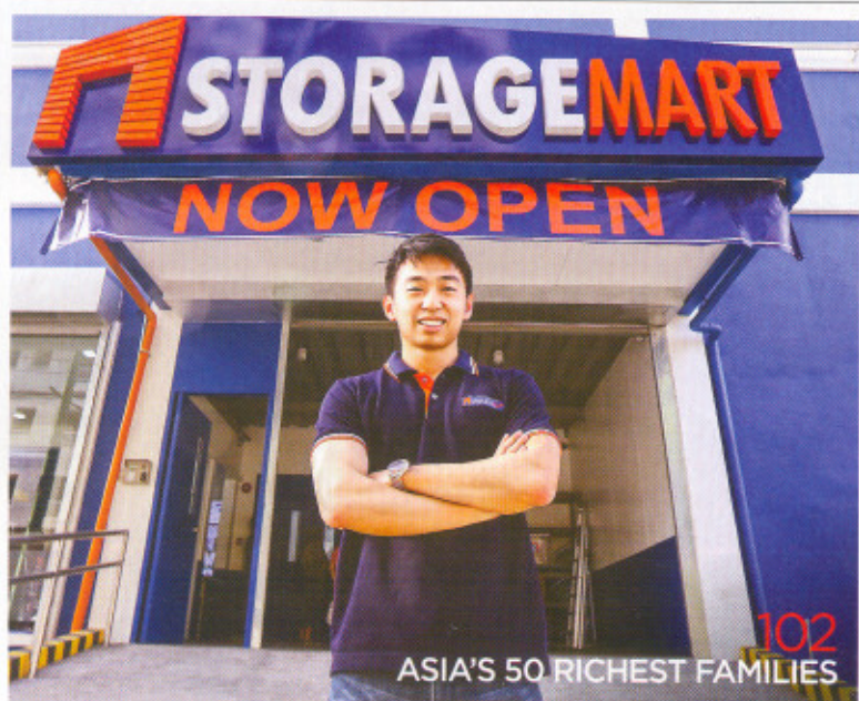
102 ASIA'S 50 RICHEST FAMILIES